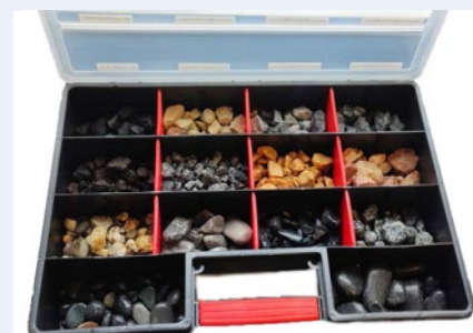
Musterkoffer mit 14 TOP-Sellern

Bestellen Sie Ihre kostenfreie Verkaufshelfer unter: