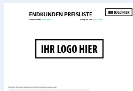
Individuelle Endkundenpreisliste mit ihrem Logo und Margen