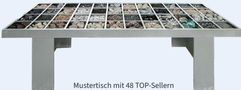
Mustertisch mit 48 TOP-Sellern Maße: 240 x 100 x 80 cm